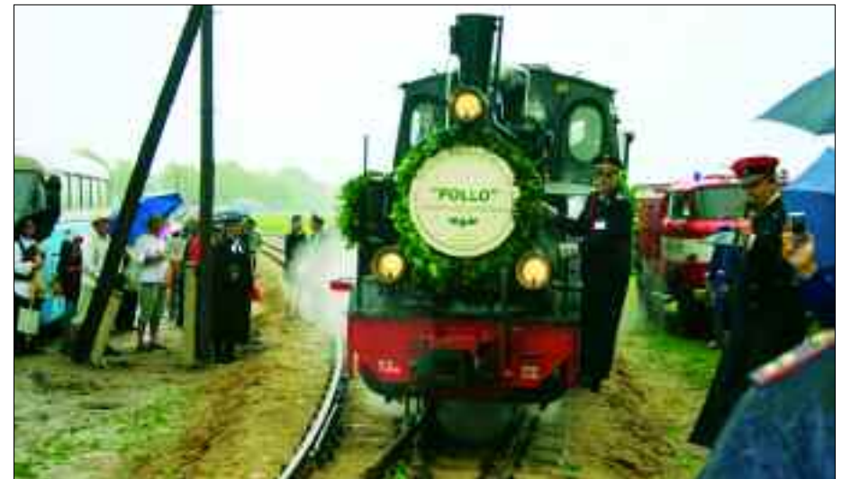
Pollo dampft am 12. Mai 2007 wieder bis nach Lindenberg