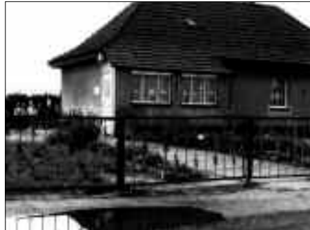
Das ehemalige Bahngelände wurde der Kindergarten in den 70er und 80er Jahren