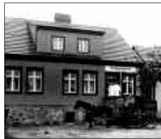
Fleischerei Alfred Krieg