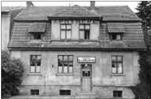
Das alte Apothekenhaus in der Hauptstraße 92