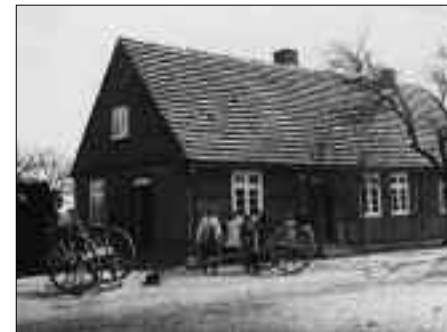
Die Stellmacherei befindet sich seit vier Generationen im Besitz der Familien Hink und Block