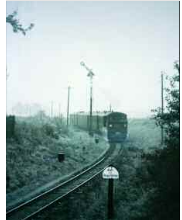
Ein Dampfzug bei der Einfahrt aus Richtung Vettin nach Lindenberg

Bauherren der Schmalspurbahnen waren die Kreise Ost- und Westprignitz. Am 15. Oktober 1897 wurde die Verbin-