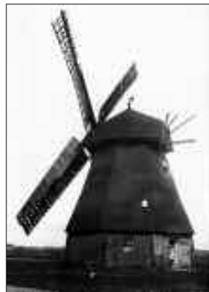
Die Mühle in Lindenberg

Nach dem 2. Weltkrieg kam Gustav Kukasch als Flüchtling 1947 nach Lindenberg in das Haus der