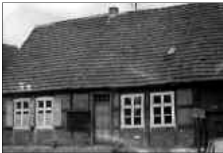
Eines der Bauernhäuser in dem Schüler unterrichtet wurden und sich bis 1989 die Schulspeisung befand