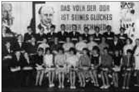
Die 8. Klasse des Jahrgangs 1969 bei der Jugendweihefeier. 81 Prozent der Schüler dieses Jahrgangs haben die Jugendweihe erhalten