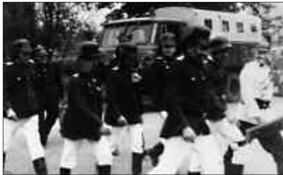
Dorffest mit Feuerwehr in den 80er Jahren

der Familie E. Schulz ging nicht so glimpflich ab, die Schweine in Stall verbrannten. Auch bei Einsätzen außerhalb von Lindenberg war die Wehr im Einsatz, so z.B. 1993 beim Hochwasser in Pritzwalk oder bei Bränden in den Nachbargemeinden. Besonders tragisch waren zwei Brände in der Nachwendezeit. In der Nacht vom 3. zum 4. November 1995 bemerkten Dorfbewohner die nach einem Vergnügen in der