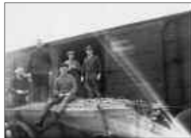
Verladung von Kartoffeln am Lindenerger Bahnhof