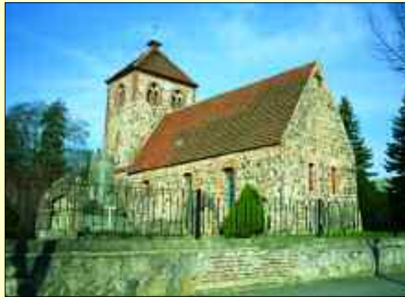
Die Geschichte des Pollo-Dorfes