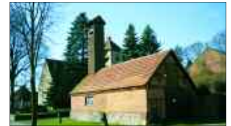
2009 wird das Gebäude saniert

Pferden gezogene Handspritze angeschafft. Mit dieser war es möglich, Brände wirksamer zu bekämpfen. In diesem Zusammenhang ist neben der Kirche in Lindenberg ein Gerätehaus mit Schlauchtrocknungsturm zur Unterbringung der Löschgeräte errichtet worden. Dieses soll im Jahr 2009 als Dorfbildprägendes Gebäude saniert werden. Danach gab es für die Wehr eine Motorspritze. Ein Nachfolger dieser Motorspritze ist in