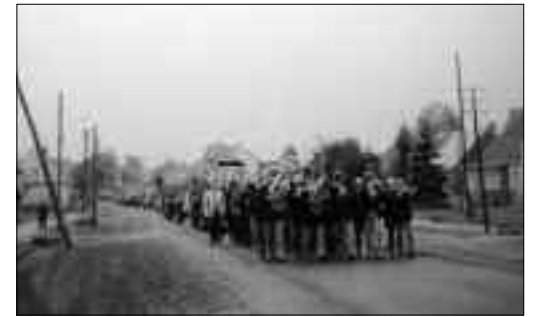
Erntefest 1984 mit böhmischer Blasmusik

die Betriebe durchgeführt bzw. unterstützt. Vielen Einwohnern ist noch der Besuch der tschechischen Freunde in Erinnerung, die mit echt böhmischer Blasmusik zum Erntetanz im Saal der LPG in Tüchen aufspielten. Der Sportverein Traktor Lindenberg erhielt finanzielle und materielle Unterstützung, genauso wie der VdGB-Chor, die Feuerwehr oder die Schule. So fuhren die Sportler zu den Auswärtsspielen mit dem