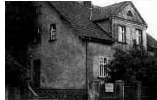
Arzthaus bzw. Landambulatorium in Lindenberg