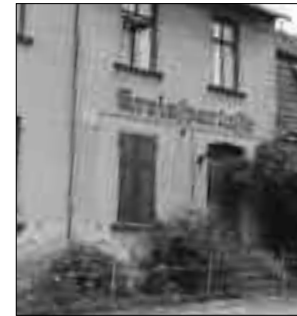
Die alte Kreissparkasse

Die Zweigstelle der damaligen Sparkasse Ostprignitz sollte ursprünglich in dem Gebäude des damaligen Großbauern Langberg (späteres Landambulatorium bzw. Arzthaus) eingerichtet werden. Da die Nutzung der Räume in dem Bauernhaus mit höheren Investitionen verbunden wären, entschloss sich der damalige Leiter der