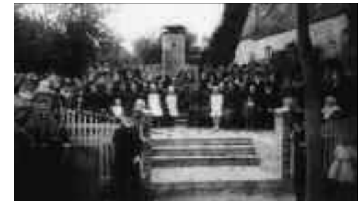
Das Bild vom 11.9.1921 zeigt die Einweihung des Kriegerdenkmals, das an die Lindenerger Opfer des vergangenen Weltkriegs erinnerte