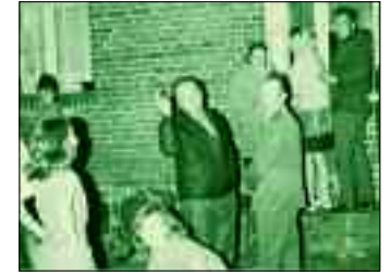
Die Fensterkieker – Wer erkennt sich wieder?

Besonders die Silberhochzeiten in den 60er und 70er Jahren hatten es in sich. Schon früh am Morgen wurde das Silberpaar mit einem Ständchen durch Freunde und Kollegen geweckt. Dann ging's zur Gaststätte, wo alle Sänger ordentlich bewirtet wurden. So konnte es passieren, dass mancher Gast mit wackligen Beinen zur Mittagszeit auf der Dorfstraße zu sehen war. Schüler, die zur Schulspeisung ebenfalls die Dorfstraße passierten, wunderten sich manchmal über die nicht ganz stand-