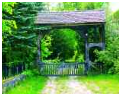
Tor zur Kirche

Der Turm wurde ebenfalls aus Feldsteinen erbaut, er hat Backsteinkanten und ein Walmdach mit niedrigen Dachbreiten. Die Westtür ist ganz schlicht in verputztem Backstein / Feldstein mit Stichbogen ausgebildet. Die Schallöffnungen aus Backstein sind spitzbogig, zu je zwei unter einem Spitzbogen gekuppelt. Die Glockenstube wurde erst im 15. Jahrhundert erbaut. Es gibt zwei Glocken, eine Eisen- und eine Messingglocke. Im Jahre 1645 wurde dem Prediger Joachim Sietmann, der zu dieser Zeit Pfarrer von Lindenberg