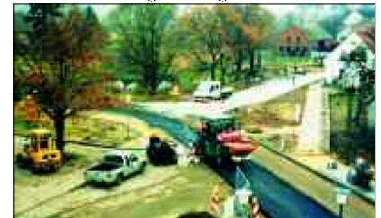
Bauarbeiten im Kreuzungsbereich am Bahnhof 1998

Schwerpunkt der Diskussionen waren der Anliegerbeitrag, die Verkehrseinschränkungen und die Hofeinfahrten. Die Anliegerbeiträge lagen zwischen 1,- und 3,- DM/Quadratmeter Grundstücksfläche (sehr gering). In der Zwischenzeit wurden in Lindenberg fünf neue Häuser gebaut, sowie auch die neue Raiffeisenbank. Trotz des baulichen Fortschritts kamen nun auch Rückschläge (die Perspektivlosigkeit im Beruf, Arbeitslosigkeit, die