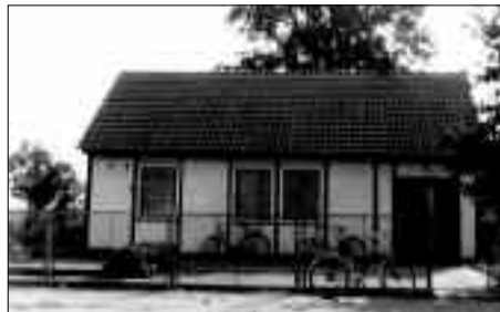
Kinderkrippe – nach Schließung und Abriss der Kinderkrippe errichtete die Raiffeisenbank ein kleines Bankgebäude, das heute ein Wohnhaus ist Lindenberg

Zu jedem Dorf in der DDR- Zeit gehörten neben der Schule auch Kindergärten und Kinderkrippen. Sie waren die Grundlage, dass auch Frauen am Arbeitspro-