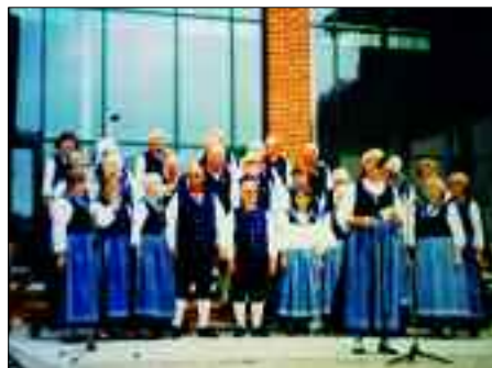
Der Luhetal- Chor aus Winsen zu Gast in Pritzwalk