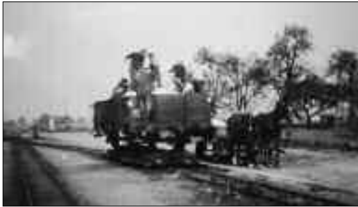
Dünger wird in Lindenberg per Hand von einem Normalspurwagen, der auf einem Rollwagen steht, auf einen Pferdewagen verladen.

bevorzugt. Der Absatz der erzeugten Produkte erfolgte an verschiedene Abnehmer. Während das Getreide größtenteils von hier abgeholt wurde, wurden die Kartoffeln vorwiegend mit der Kleinbahn abtransportiert. Die geernteten Fabrikkartoffeln gingen in Richtung Stärkefabrik Kyritz. Sie wurden in offenen Waggons mit einer Ladefähigkeit von 5 Tonnen fortbewegt. Zuckerrüben und Speisekartoffeln wurden in Normalspurwagen, die auf sogenannten Rollwagen oder Rollböcken standen, hauptsächlich in Richtung Glöwen abtransportiert.