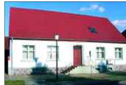
Ehemalige Schule, heute Gemeindehaus; der Klassenraum der einklassigen Volksschule befand sich 1907 auf der linken Seite

auch der Soldatenkönig Friedrich Wilhelm I. Gedanken. 1717 formulierte der Preußenkönig: „An Orten, wo es Schulen gab, sollten die Eltern ihre Kinder gegen zwei Dreier wöchentliches Schulgeld im Winter täglich und im Sommer wenigstens ein- bis zweimal in der Woche zur Schule schicken. Falls aber die Eltern das Geld nicht hätten, sollten die zwei Dreier aus der Armenkasse des Ortes bezahlt werden.“ Eine gute schulische Ausbildung auf dem Lande gab es damit aber auch noch nicht. Die Regel waren unausgebildete Lehrer, marode Schulgebäude, Schulzimmer ohne Bänke und Unterrichtsmaterialien für die Schüler.