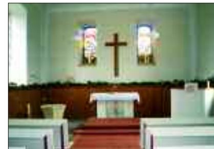
Blick in den Innenraum der Kirche