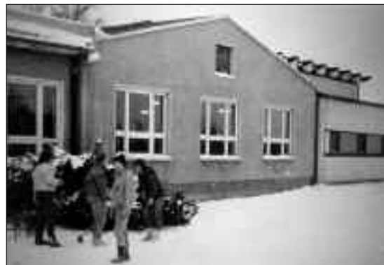
Die Neue Schulspeisung und Turnhalle 1990