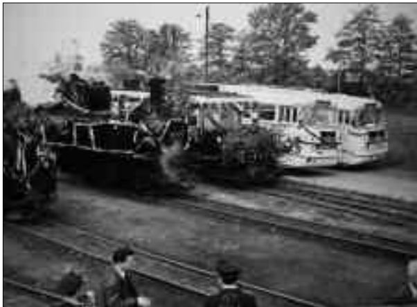
31. Mai 1969: Verkehrsträgerwechsel in Lindenberg

Im Mai 1969 stand in der Märkische Volksstimme unter der Überschrift „Kleinbahn hat ausgedient- Verkehrsträgerwechsel auf Kleinbahnstrecken ab 1. Juni“: „Mit Wirkung vom 1. Juni 1969 werden in unserem Kreis und im Kreis Kyritz noch bestehende Kleinbahnstrecken der Deutschen Reichsbahn stillgelegt. Der VEB Kraftverkehr übernimmt die Strecken im Rahmen des Verkehrs-